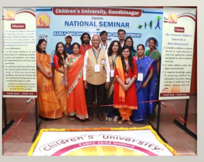
Service Rendered by Students in National Seminar